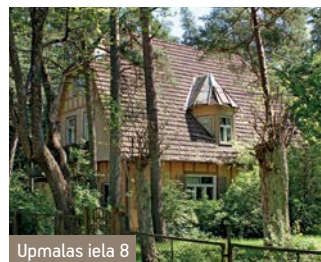
Upmalas iela 8