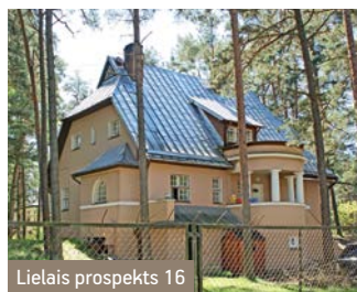
Lielais prospekts 16