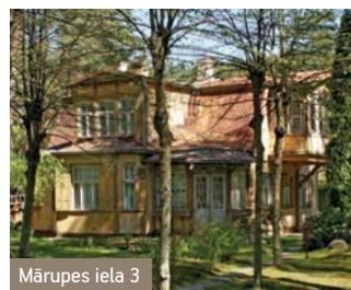
Mārupes iela 3