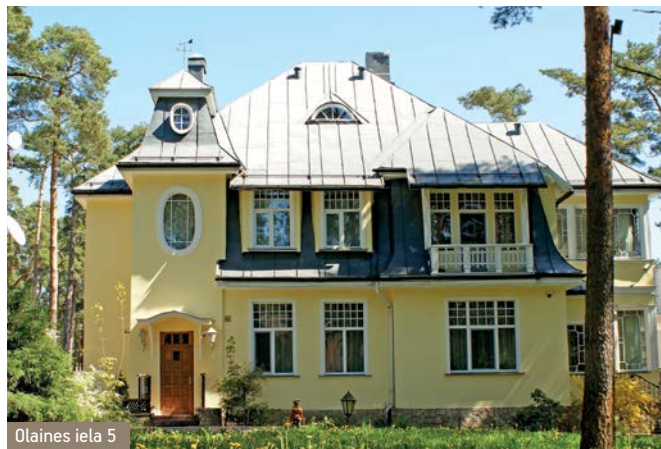
Olaines iela 5

Priedaines apkārtnē ir vienīgā Jūrmalas teritorijā Lielupes labajā krastā. Te atrodas vairāki ievērojami dabas objekti – Baltā kāpa, Sļēpera purvs, Darmštates priēžu audze, Buļļupes atteka ar Vārnukrogu, Varkaļu kanāls un vienīgais arheoloģijas piemineklis Jūrmalā – Babītes pilskalns.