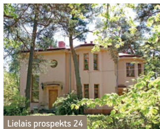
Lielais prospekts 24